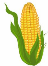
とうもろこしは ごしごしご～し