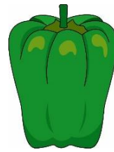
ピーマン ぴっぴっぴ