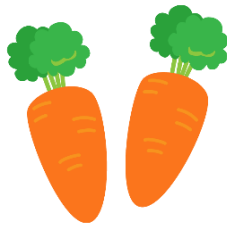
にんじん にんにんにん