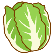
はくさい くさいくさいくさい