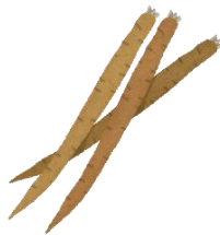
ごぼうは ひょ～ろひょろ