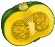
かぼちゃは ちやちやちや