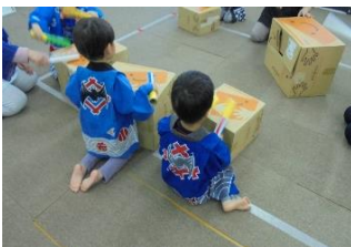
お祭り！太鼓を叩いたよ