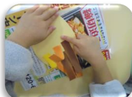
〈下から貼りつけ上に重ねていきました〉