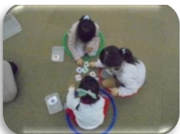
まるさんかくしかくカルタ