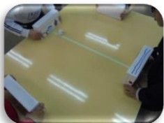
【テーブルホッケー】

3月はテーブルホッケーを4人で行なったり、けん玉を2種類、ぶんぶんゴマを行いました。最初はできなかったことも練習し、出来るようになったことを子どもたちと一緒に喜ぶことができました。