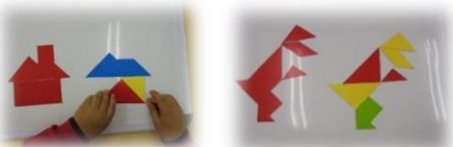
【マグネットパズル】