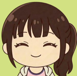
まるやませんせい