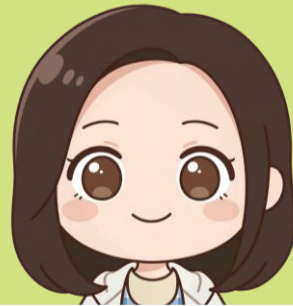
いしやませんせい