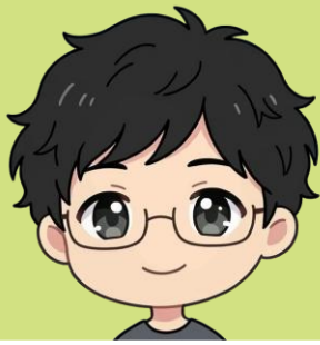
うちやませんせい